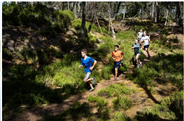
Crédits photos : exposition émotions sportives au Grand Parquet jusqu'à fin novembre 2023