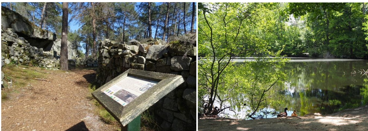
Crédits photos : Sentier des carrières - mare aux évèes, office de tourisme du Pays de Fontainebleau

Précieuse pour ses habitants et ses nombreux visiteurs, ancien domaine de chasse des rois de France, la forêt de Fontainebleau, qui s'étend sur plus de 22 000 ha de nature préservée mérite bien son titre de « Forêt d'Exception® ». Une nature rayonnante et sensible, célèbre dans le monde entier et qui a inspiré de nombreux artistes depuis le XIX ème siècle, véritable invitation au voyage. Profitez de septembre pour (re)découvrir, avec respect et bienveillance, ce patrimoine naturel fabuleux : au travers d'itinéraires et circuits ou au travers des nombreuses activités de pleine nature, enrichissantes et ressourçantes que propose l'office de tourisme du Pays de Fontainebleau.