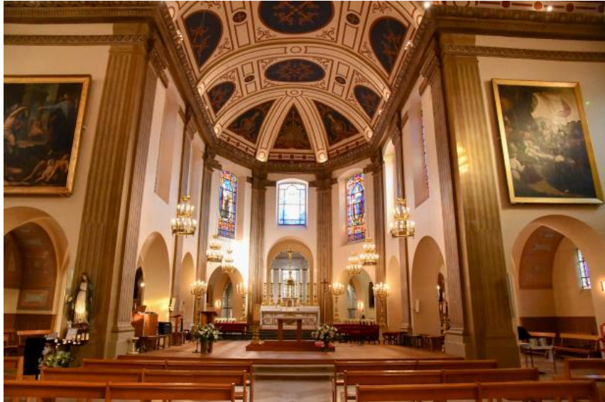
Crédits photos : L'Empereur Napoléon III © RMN-Grand Palais (Château de Versailles) Gérard Blot - Eglise Saint-Louis, ville de Fontainebleau

Du 15 septembre au 19 novembre 2023, venez découvrir l'exposition " Fontainebleau, la ville sous le Second Empire (1852 - 1870) », dans l'Atelier de la Charité Royale. Le Second Empire a laissé à la ville de Fontainebleau une empreinte indélébile. Dans le cadre des commémorations liées aux 150 ans de la mort de Napoléon III, cette exposition présentera de rares et exceptionnels objets, un parcours thématique, où se côtoient peintures, sculptures, photographies, mobiliers, objets d'art, etc. qui brosse le portrait de cette époque foisonnante et riche. Atelier de la Charité Royale / Médiathèque, 15 rue Royale, Fontainebleau.